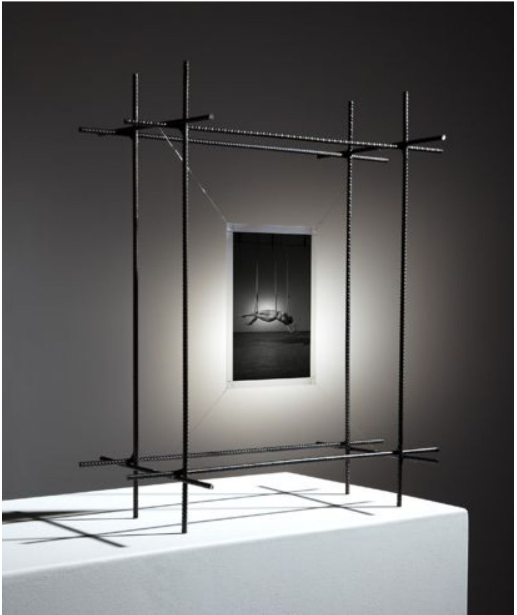
« Cordes », 2011