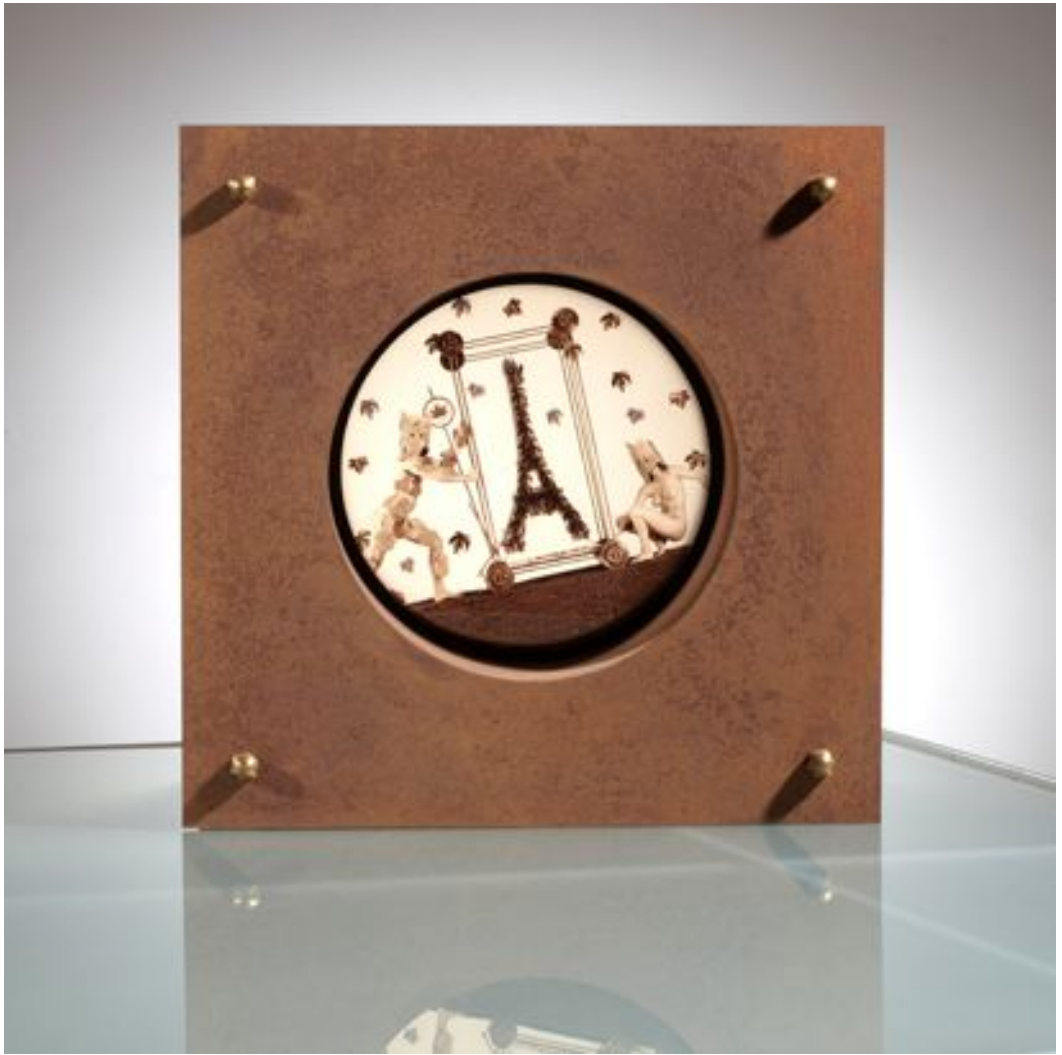
« Le vol de la tour Eiffel », 1999