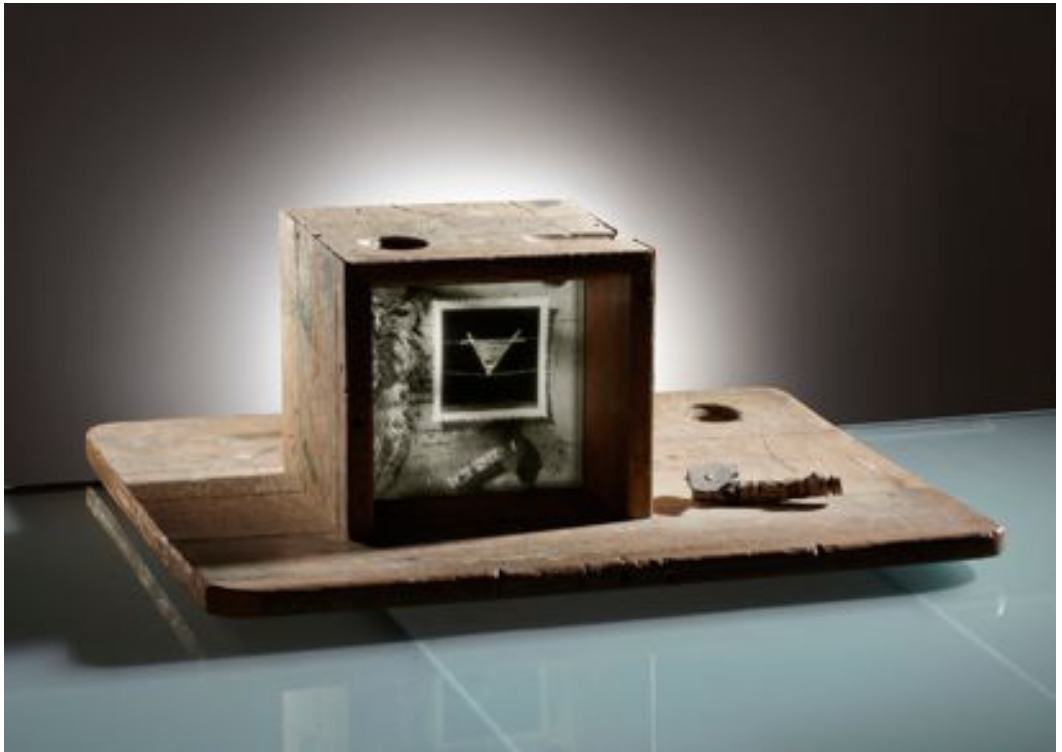
« La leçon de choses », 1991