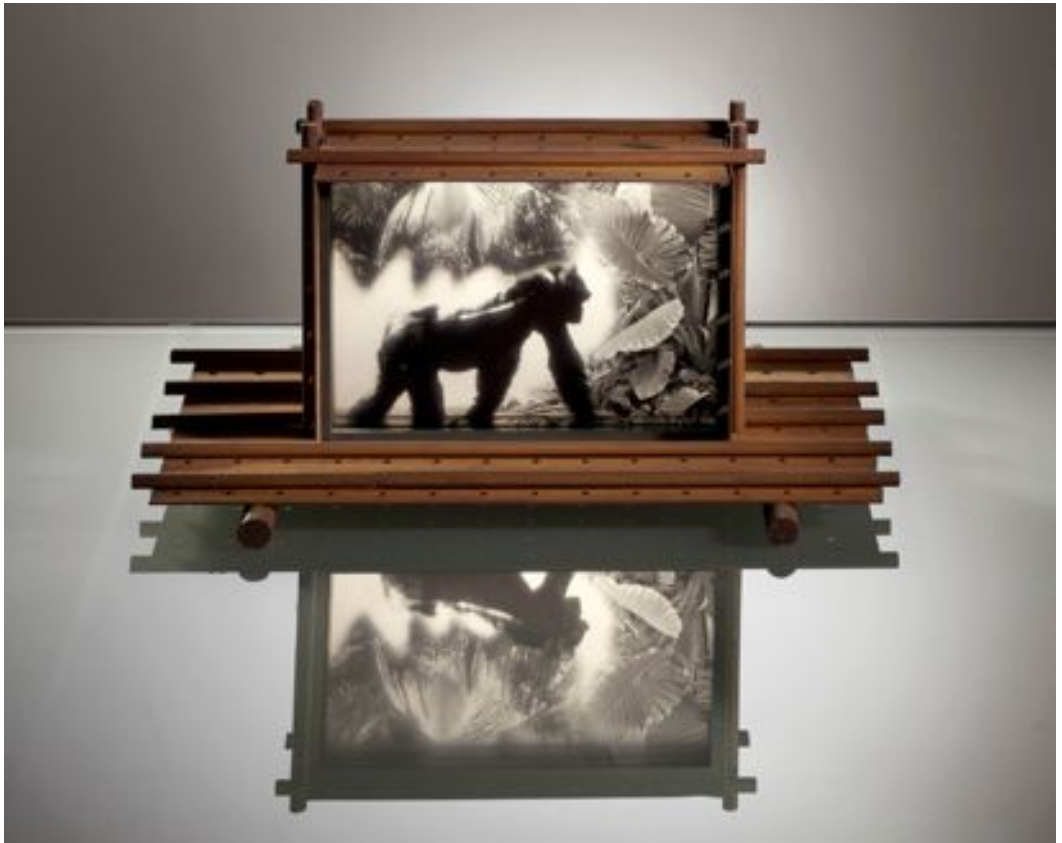
« Gorille, la cage oubliée », 1992