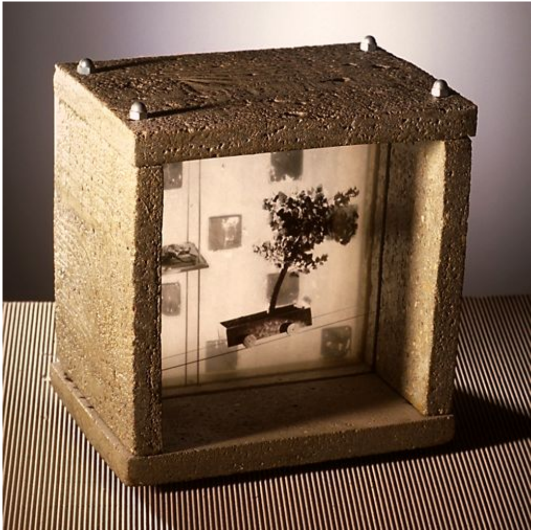
« Le wagonnet », 1990